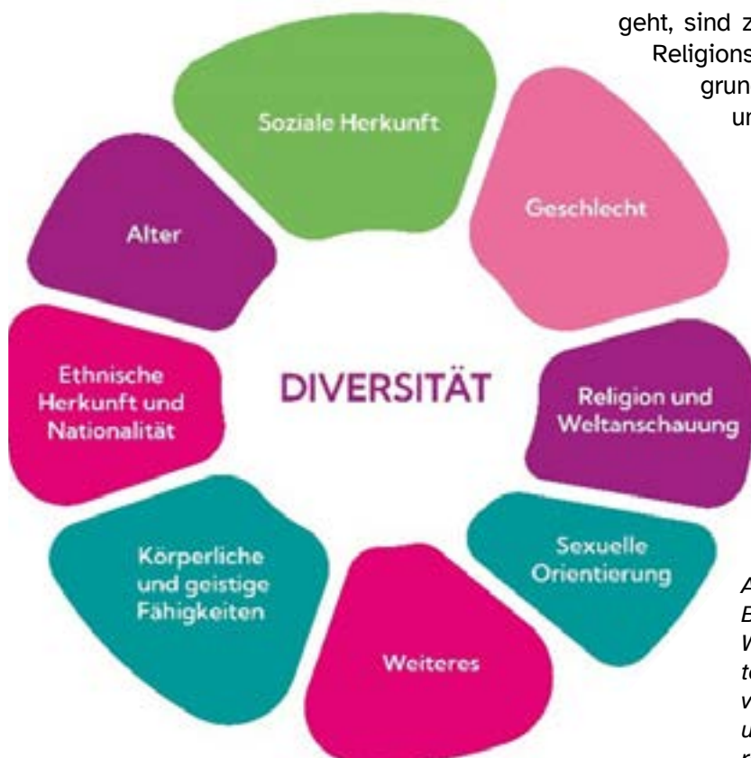
Abb: Die Grafik soll eine Blüte mit ihren Blättern darstellen. In der Mitte steht das Wort Diversität und auf den einzelnen Blütenblättern darum herum finden sich die Diversitätsdimensionen: Geschlecht, Religion und Weltanschauung, sexuelle Orientierung, Alter, ethnische Herkunft und Nationalität, körperliche und geistige Fähigkeiten und weiteres.

Jede Vielfaltsdimension hat eine gesellschaftliche Bedeutung und Zuschreibung. Bestimmte Dimensionen können vornehmlich wahrgenommen werden, sodass Menschen nur auf eine ihrer Dimensionen reduziert werden und entsprechend diskriminiert werden. Die gesellschaftliche Bewertung der unterschiedlichen Vielfaltsdimensionen führt dazu, dass Zugänge und Teilhabe- und Diskriminierungsmechanismen miteinander verbunden sind. Relevant, wenn es um Zugänge und Teilhabe geht, sind z. B. Herkunft, Hautfarbe, Nationalität, Religionszugehörigkeit oder Bildungshintergrund. Sie spielen eine Rolle, wie wir durch unser Umfeld wahrgenommen werden, welche Verantwortung uns zugetraut wird, wie wir behandelt werden, welchen ersten Eindruck wir hinterlassen, welche Erfahrungen wir machen und wie wir uns selbst sehen. Diese Dimensionen wirken dabei nicht isoliert, sondern können sich überschneiden und verstärken. Das wird als Intersektionalität bezeichnet und kann zu Mehrfachdiskriminierungen führen (siehe das folgende Kapitel zu Intersektionalität).